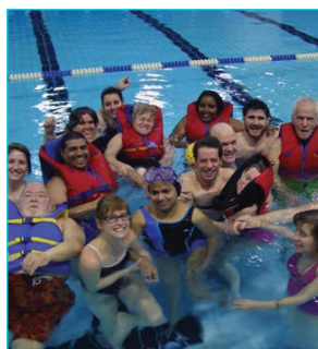
Le groupe à l'activité aquatique.

D'ailleurs, l'organisation des Jeux du Québec annonçait dernièrement qu'elle rend accessible la boccia aux jeunes dès 2013. Cette ouverture démontre un avenir prometteur pour le déploiement de ce sport auprès de la relève à travers le Québec. En prenant en main le développement d'une équipe junior à Montréal, le CIVA souhaite favoriser davantage la santé auprès des jeunes qui vivent avec un handicap physique, tout en les amenant à acquérir des habiletés qui les aident à faire leur place dans la vie.