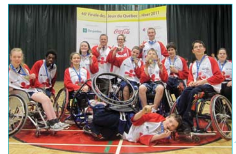
Les Mini-Tornades, vainqueurs aux Jeux du Québec.