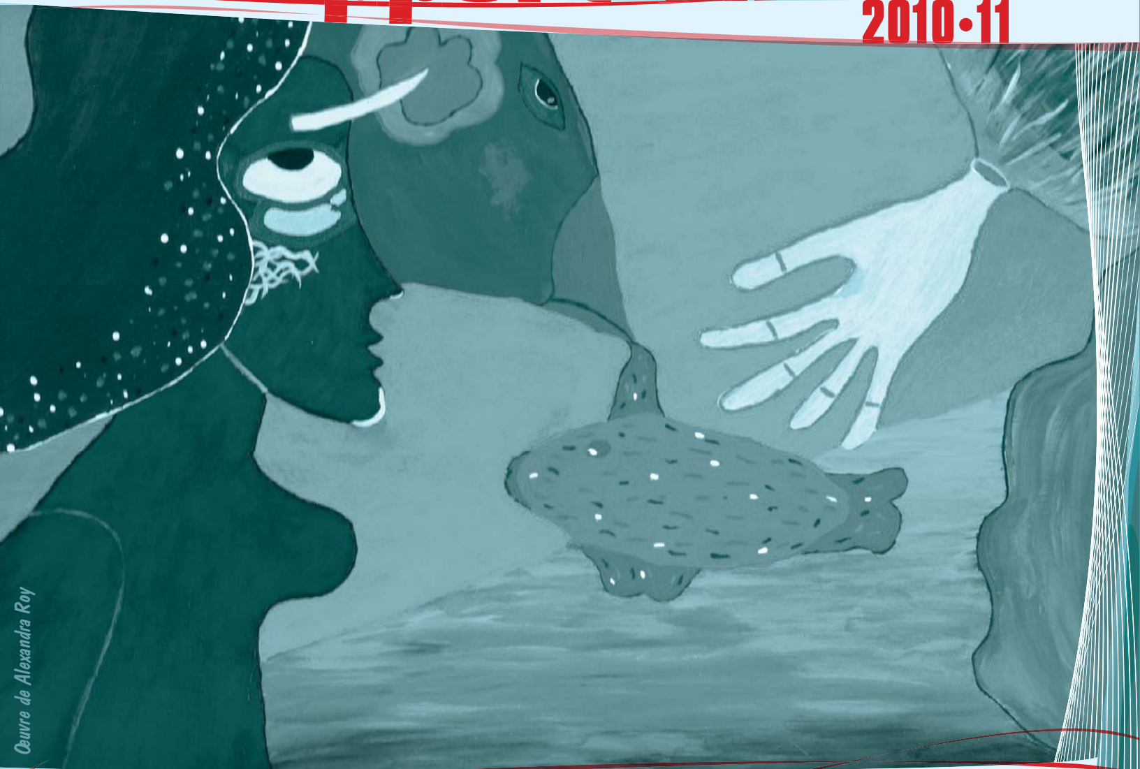
Oeuvre de Alexandra Roy

50 ans d'action à bâtir au-delà des barrières