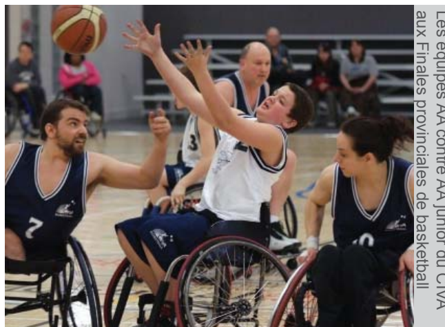
Les équipes AA contre AA junior du CIVA aux Finales provinciales de basketball

Inscription activités d'ÉTÉ : 18 et 21 juin