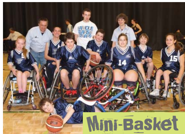
L'équipe des Mini-Tornado