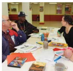
Groupe du cours Créativité