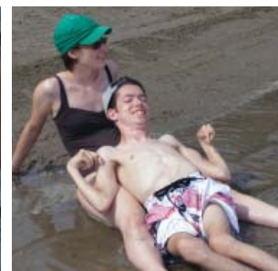
Sortie à la plage