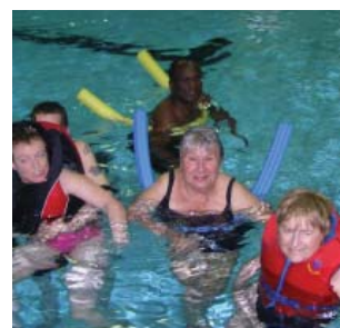
Groupe à la piscine